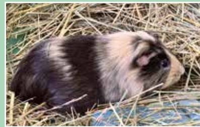
▲モルモットに会いに那須の牧場へ行きました！