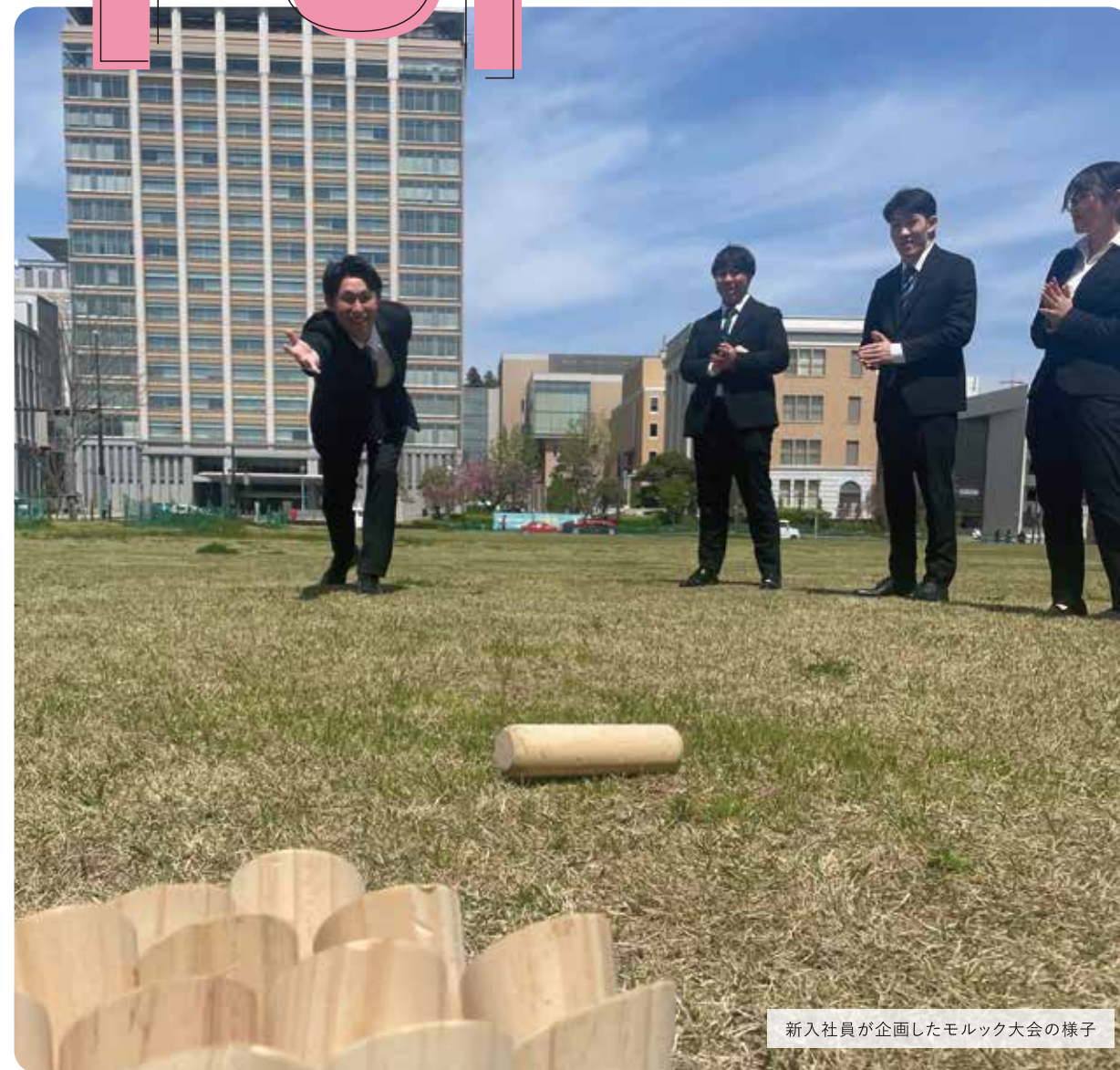
新入社員が企画したモルック大会の様子